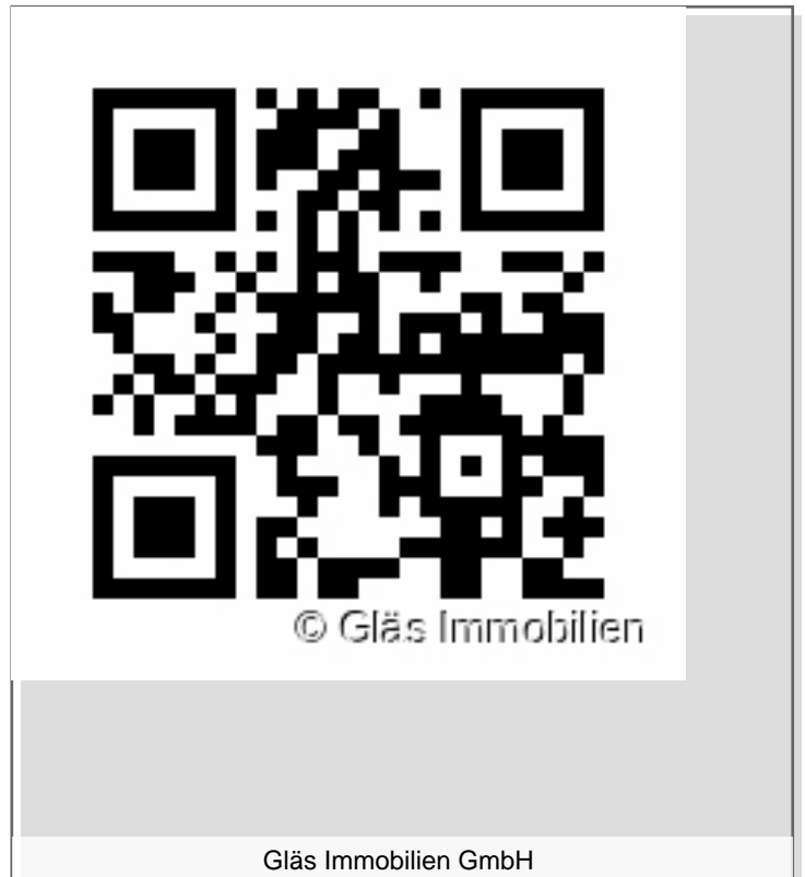
Gläs Immobilien GmbH