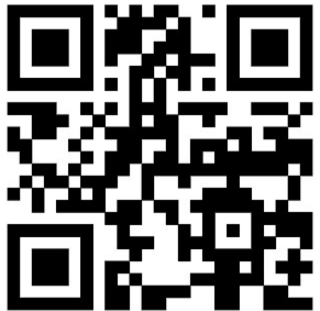
Gläs Immobilien GmbH