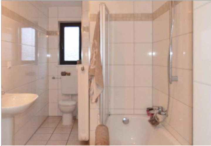
neu renoviertes Bad