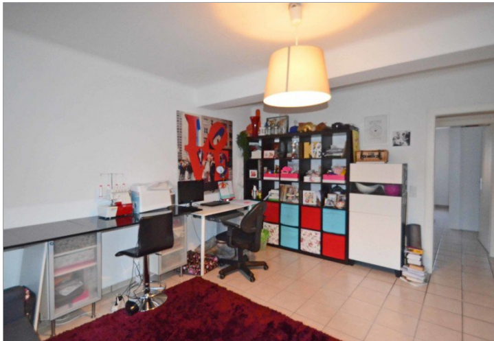
Kinder- bzw. Arbeitszimmer