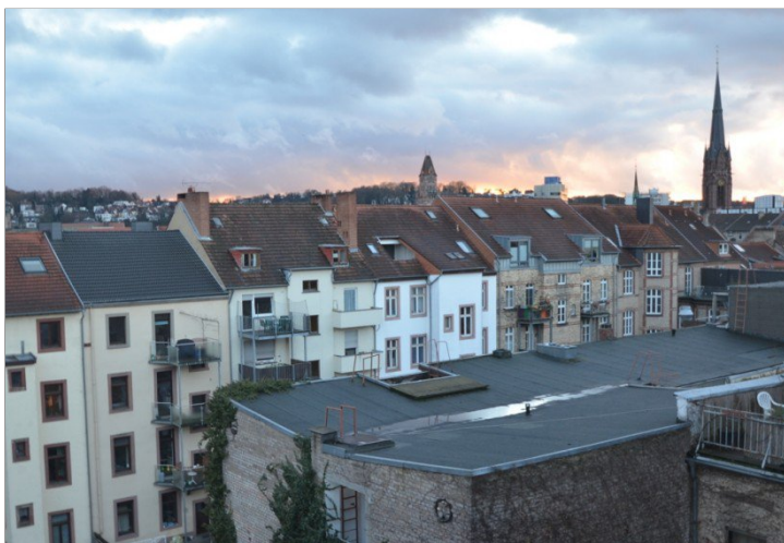
Über den Dächern von Saarbrücken