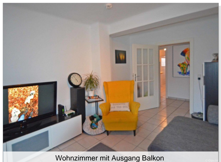
Wohnzimmer mit Ausgang Balkon