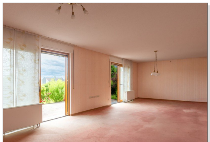
Wohnen/Essen mit Zugang zum Garten