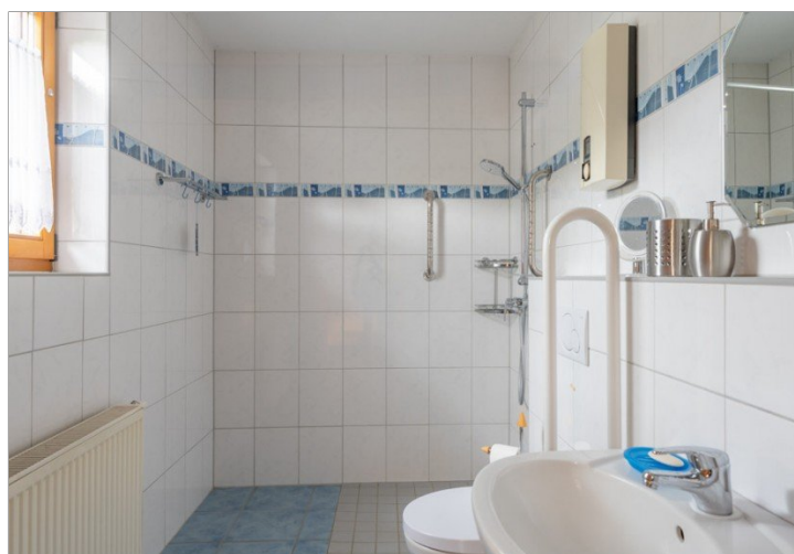
Bad mit bodengleicher Dusche im EG