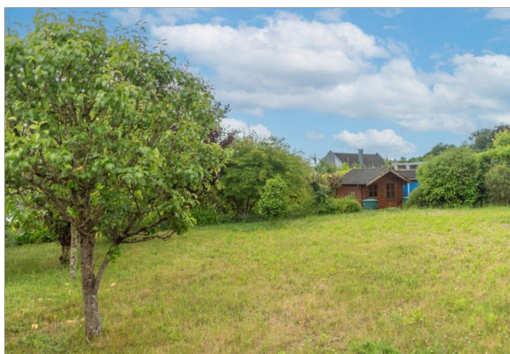
Viel Platz zum Toben