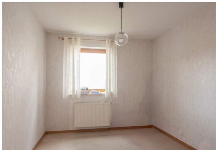
Gäste-/Arbeitszimmer im EG