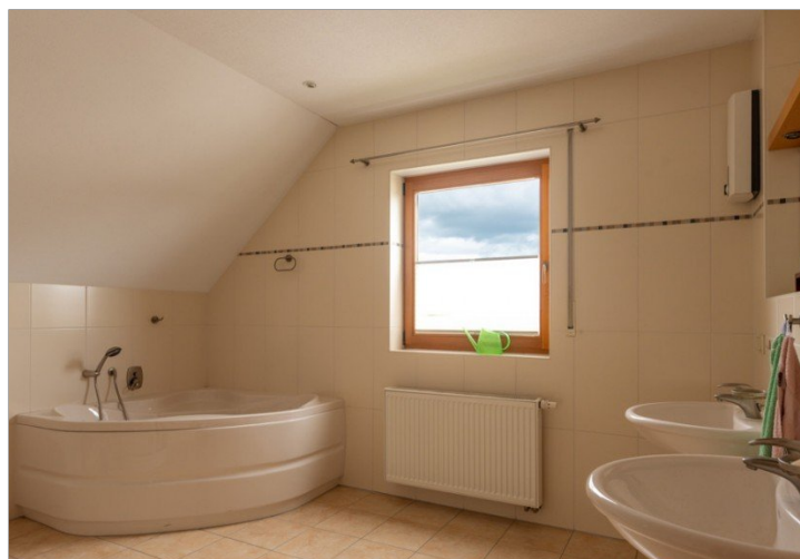
Badezimmer mit Eckbadewanne und...