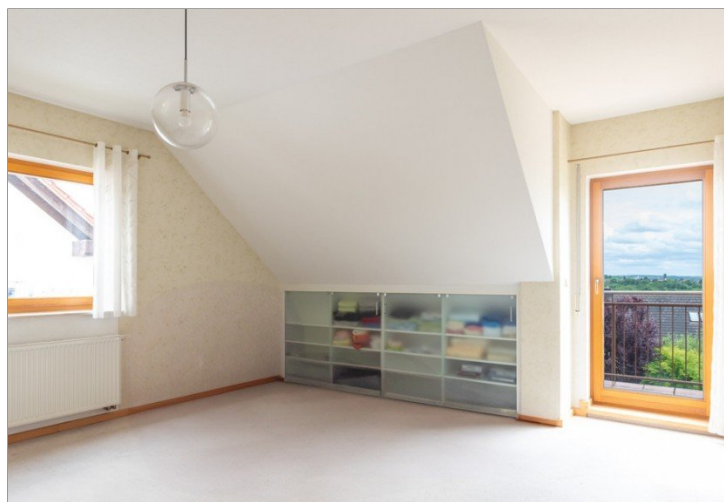
Kinderzimmer mit Balkon