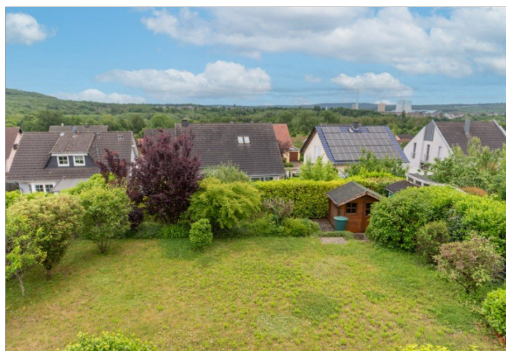
Fernsicht vom Balkon