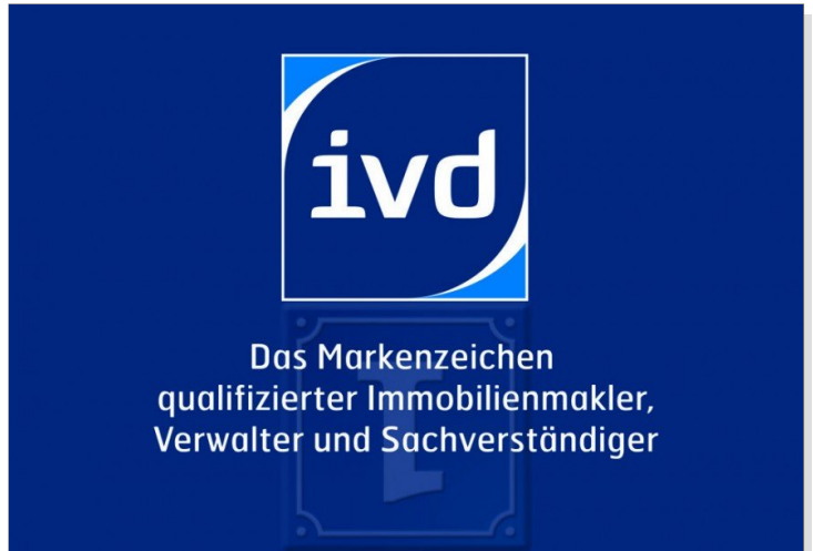
Mitglied im IVD