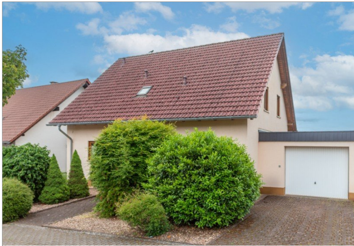
Freistehendes Einfamilienhaus in bester Wohnlage