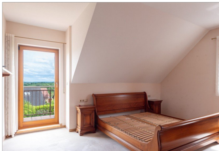
Elternschlafzimmer mit Fernsicht