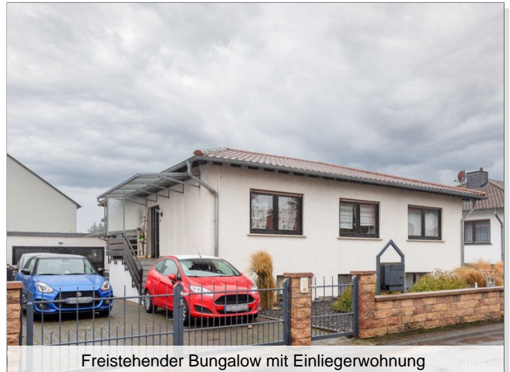
Freistehender Bungalow mit Einliegerwohnung