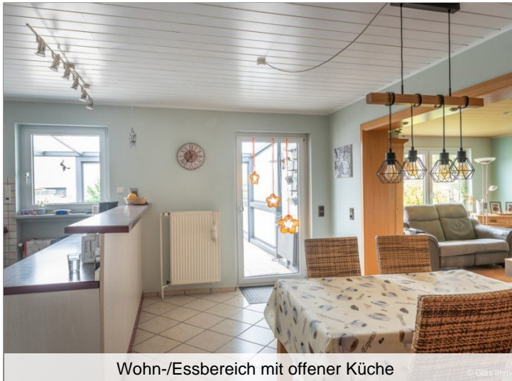
Wohn-/Essbereich mit offener Küche