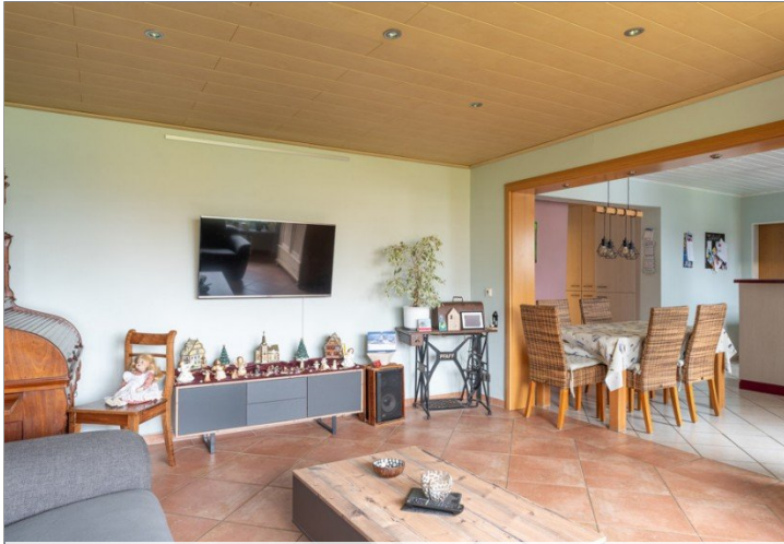
Wohnzimmer mit Blick Richtung Küche