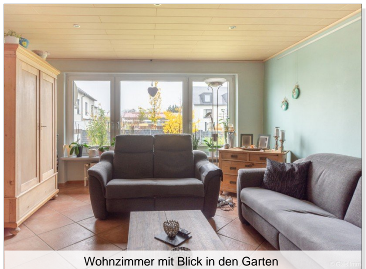
Wohnzimmer mit Blick in den Garten