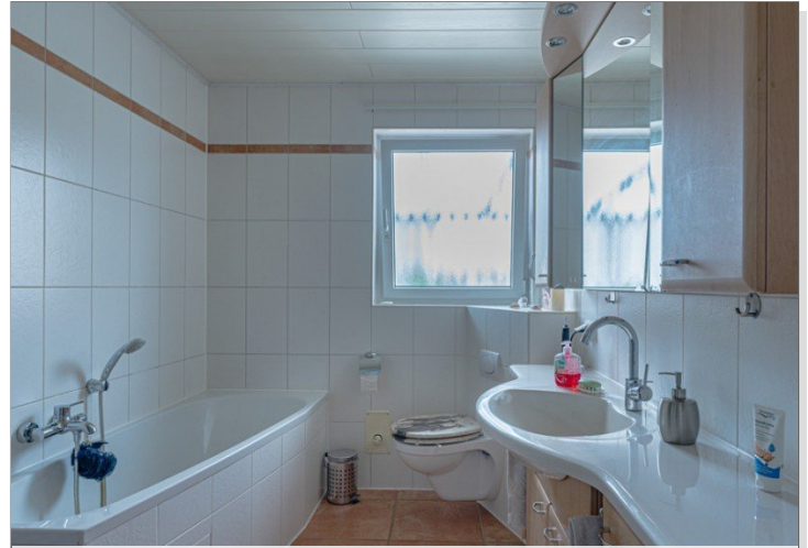
Badezimmer mit Wanne und...